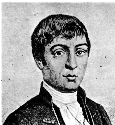
Hipólito Ruiz López (1754-1816)