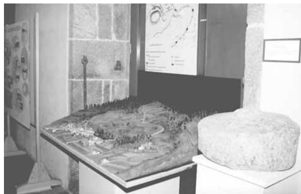
Figura 6: Detalle da exposición sobre a cultura castrexa organizada pola Asociación no ano 2001

Esta circunstancia pódese relacionar cunha perspectiva excesivamente academicista que obvia a natureza e función social dunha disciplina humanística como a Arqueoloxía. Todo isto explica que se teña marxinado -de maneira inconsciente a miúdo- o traballo co produto sociocultural da investigación arqueolóxica por antonomasia: o Patrimonio Arqueolóxico. Asemade as iniciativas que xurden por parte da poboación interesada neste tema, como son asociacións de afeccionados á Arqueoloxía, apenas son escoitadas por parte dos especialistas e da Administración.