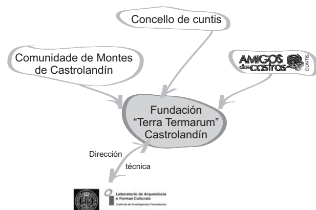
Figura 4: Entidades vencelladas á Fundación Terra Termarum.

Como froito de todo iso chégase ó acordo de elaborar e executar un Plan Director para a posta en valor de Castrolandín .