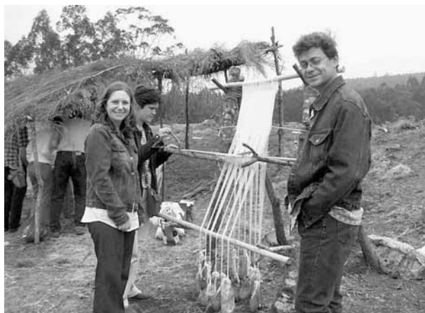
Figura 7: Talleres castrexos no castro de Castrolandín (San Xoán de 2002)

O poboamento castrexo é o obxecto de estudo do quinto apartado, no que se sintetizan os contidos da exposición organizada en Cuntis no ano 2001 pola