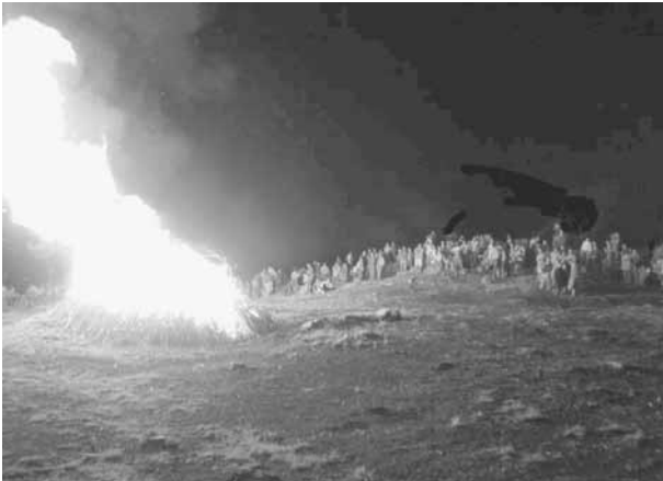
Figura 3: Celebración do S. Xoán na croa do castro (ano 2001).

mouras desencantábanse e transformábanse en mulleres normais.