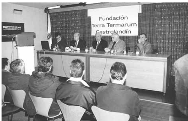
Figura 5: Presentación oficial da Fundación Terra Termarum (ano 2001)

Co Plan Director proxectado procúrase deseñar unha actuación que permita en cinco anos recuperar Castrolandín como recurso socio-cultural para a bisbarra Ulla-Umia.