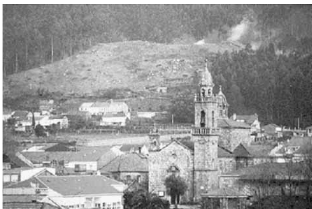
Figura 2: A vila de Cuntis co castro de Castrolandín ó fondo.

Dende aquela as mulleres xa poden volver ó río, atravesalo cos cántaros de leite, e os mouros enterráronse no castro e non saen nunca del. Só nas noites de San Xoán, xúntanse e prenden unha coroa de lumes na croa do castro e botan rodas ardendo dende o castro abaixo para lembrar a todos os veciños do val o seu antigo esplendor e gloria.