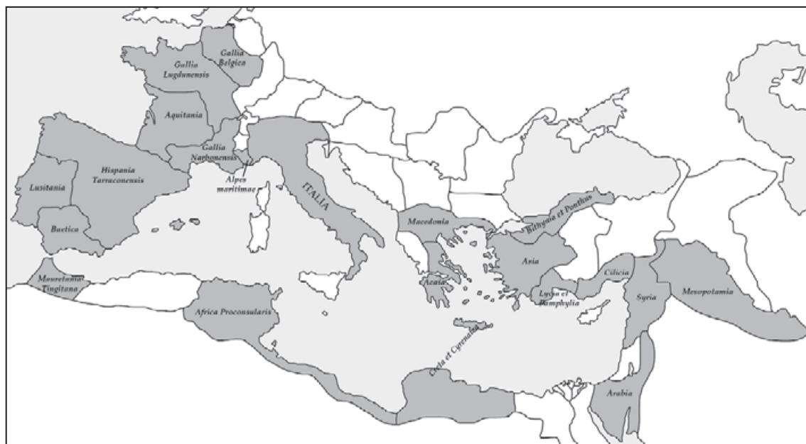
Fig. 1. Carte de l'empire romain, avec indication des territoires provinciaux traités dans Camporeale et al. 2008 et 2010.

políticos muy complejos y por la economía en el sentido más amplio del término, como conjunto de producción y distribución de bienes. Para la época romana, ha sido necesario esperar hasta las investigaciones recientes para considerar el sector de la construcción como un indicador de la vitalidad económica 10 . La singularidad de Choisy es la de haber conseguido la integración de estas cuestiones en su particular enfoque, participando al nacimiento de las ciencias sociales en Francia, a finales del siglo XIX 11 . Así, su Art de bâtir se fundamenta en un análisis amplio sobre la organización de las corporaciones de los trabajadores y la historia de la técnica integrando plenamente la historia social 12 .