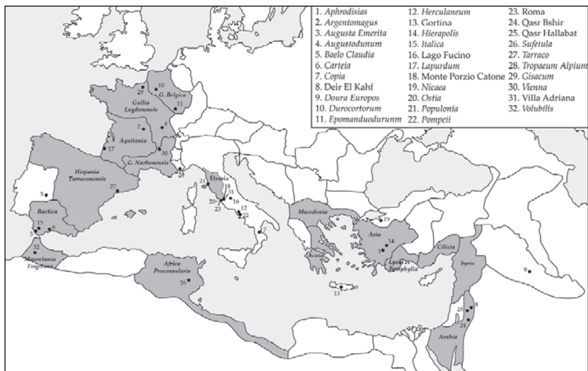
Fig. 2. Carte de l'empire romain, avec indication des sites ou monuments et des études régionales traitées dans Camporeale et al. 2008 et 2010.

verdadera práctica productiva que implica distintos conocimientos profesionales peculiares y se enmarca en una “cadena de operaciones” bien articulada (los cambios en las operaciones y las transformaciones técnicas desde la materia prima hasta el acabado final) 15 .