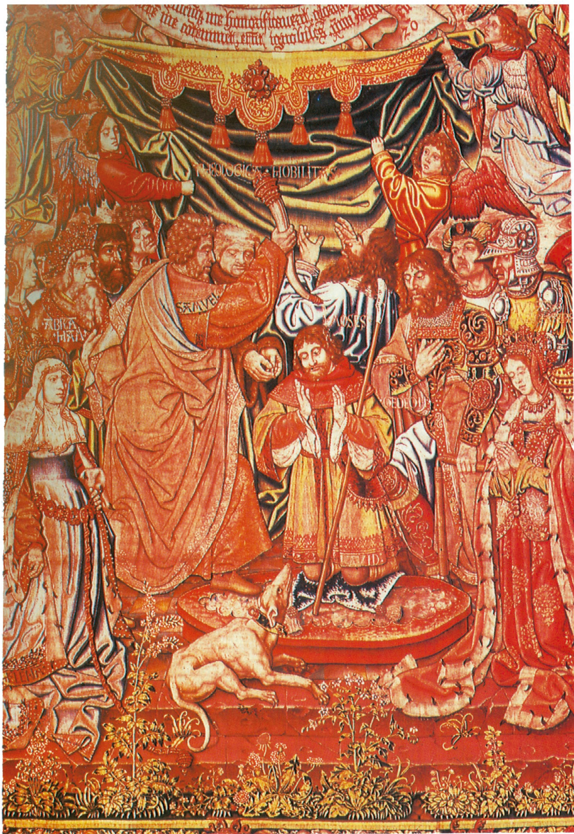
Nobilitas, tapiz nº 8 de la serie Los Honores. Palacio Real de La Granja de San Ildefonso