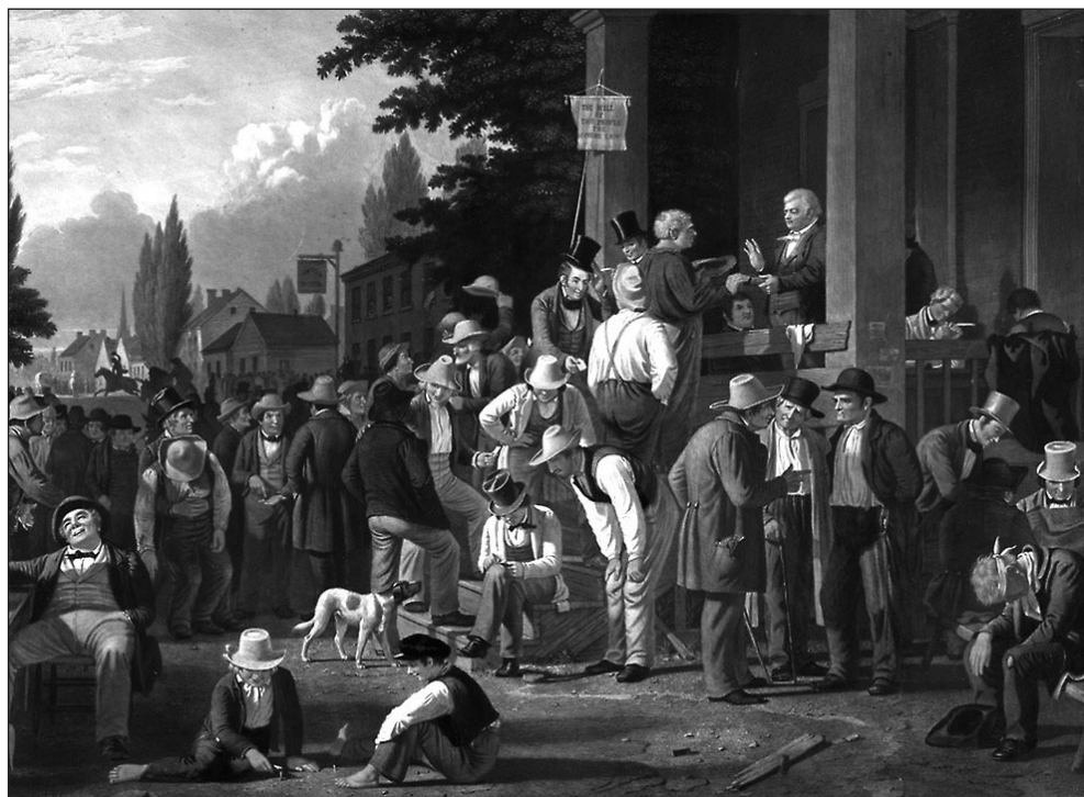
ILUSTRACIÓN 1. Votación a viva voz en Inglaterra a mediados del siglo XIX

Fuente: George Caleb Bingham (1811-1879) English: The County Election. 1852.