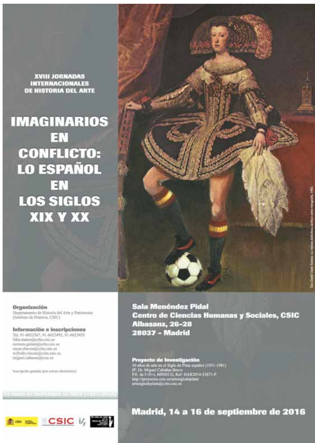
Fig. 1. Cartel de las XVIII Jornadas Internacionales de Historia del Arte: Imaginarios en conflicto: lo español en los siglos XIX y XX (Madrid, CCHS-CSIC, 14 a 16 de septiembre de 2016).