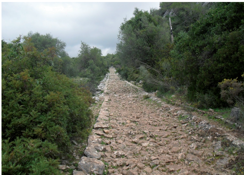
Figura superior: Calzada romana Ubrique-Benaocaz. Lo que en el pasado era una vía de comunicación entre poblaciones representa en la actualidad un atractivo para el uso recreativo de senderistas y visitantes públicos en los montes de Andalucía.

Consejo Superior de Investigaciones Científicas (CSIC)