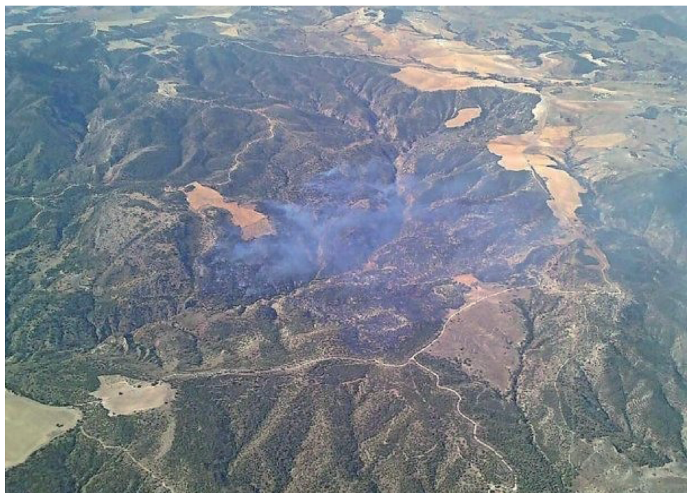
Figura superior: Vista aérea de las zonas afectadas por el incendio que afectó a la zona de Quesada en el Parque Natural de Cazorla, Segura y Las Villas.

Consejo Superior de Investigaciones Científicas (CSIC)