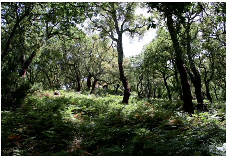
Figura superior: La variedad del paisaje forestal de Andalucía abarca todos los rangos climáticos que pueden encontrarse en la región mediterránea. En esta foto se muestra un alcornocal en el momento de máxima explosión vegetativa sobre un sotobosque de helechos.

Consejo Superior de Investigaciones Científicas (CSIC) 1 e Instituto Nacional de Investigación y Tecnología Agraria y Alimentaria (INIA) 2